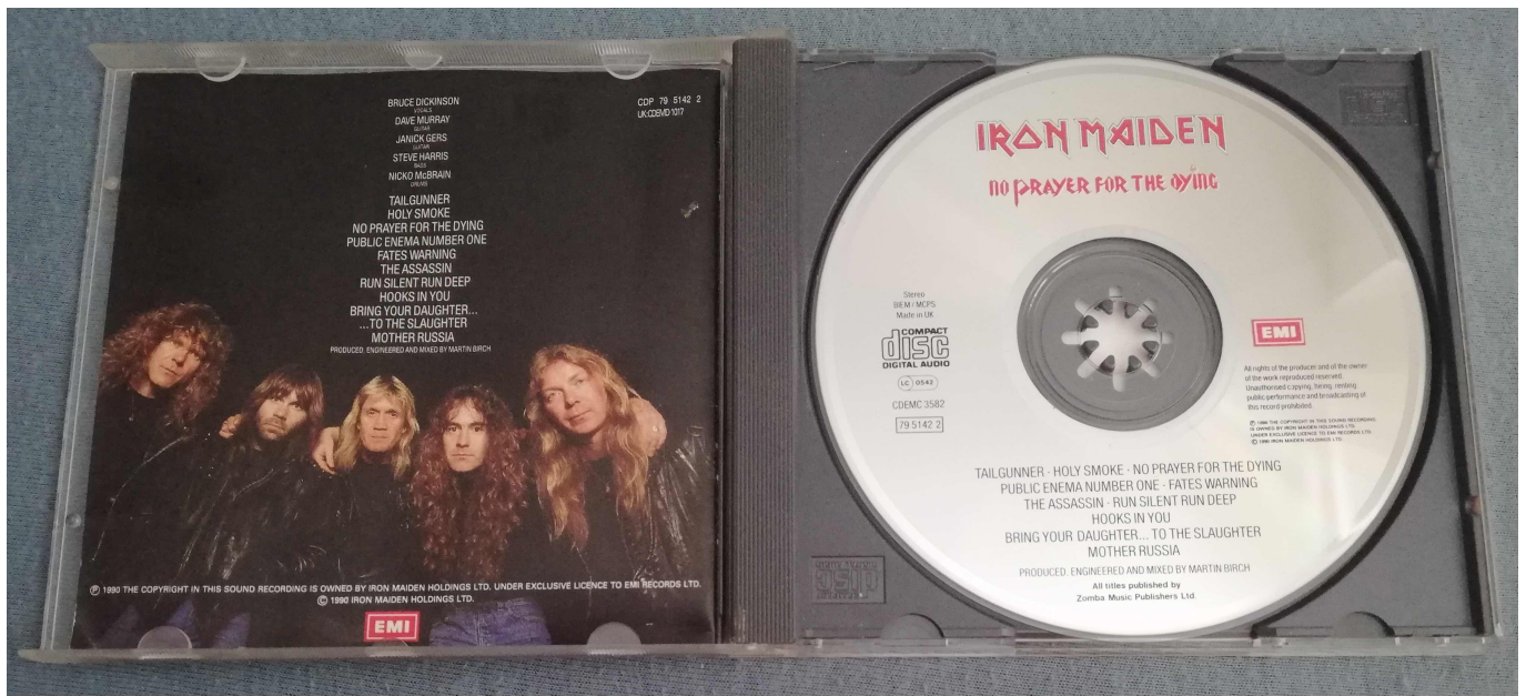
Pressage anglais avec titres en rouge